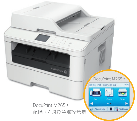
DocuPrint M265 z 配備 2.7 吋彩色觸控螢幕